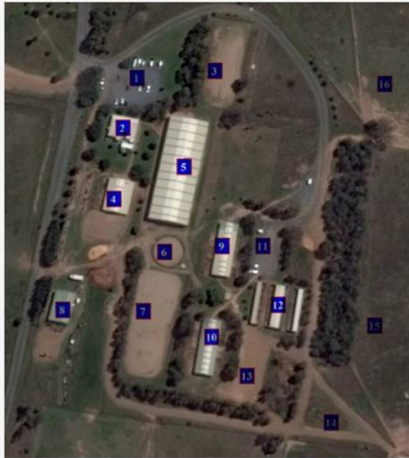
Aerial View of Facilities